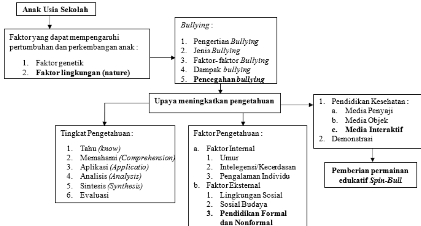
Gambar 2. 1 Kerangka Teori

Sumber : (Irawan et al. , 2022), (Rasmitadila, 2023), (Wasiyah et al. , 2023), (Lating et al. , 2024), Notoatmodjo (2022).