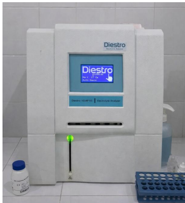
Gambar 3. Electrolyte Analyzer Diestro 103AP V3