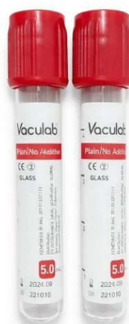
Gambar 2. Tabung Vacutainer Plain

Meskipun tabung harus dibiarkan membeku sempurna sebelum disentrifugasi, tabung ini tidak boleh dibiarkan lebih dari satu jam setelah pengambilan darah, karena kontak yang terlalu lama dengan sel-sel di dalam tabung tersebut dapat menyebabkan perubahan kimia di dalam serum yang akan memengaruhi hasil uji. Kemungkinan perubahan tersebut dapat meliputi penurunan kadar glukosa serum, peningkatan kadar besi serum, dan peningkatan kadar kalium serum (Lieseke & Zeibig, 2018).