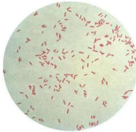
Gambar 1. Sel Bakteri Pseudomonas aeruginosa

Pseudomonas aeruginosa memiliki 3 kelompok ciri koloni. Koloni yang kecil dan kasar berasal dari isolate alami tanah dan air. Koloni dengan jumlah satu atau dua dan koloni halus berasal dari bahan klinik. Koloni Pseudomonas aeruginosa berbentuk seperti telur besar, halus, dan tepi datar. Sedangkan koloni yang berasal dari sekresi saluran pernapasan dan saluran kemih akan berbentuk mukoid atau berlendir. Strain bakteri ini membentuk dua tipe pigmen yaitu pigmen pyoverdin fluoresen berwarna hijau dan pigmen pyocyanin berwarna biru (Soedarto, 2015). Sel bakteri Pseudomonas aeruginosa ditunjukkan pada Gambar 1.