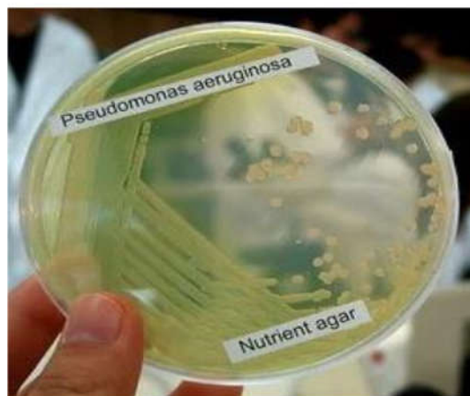
Gambar 2. Koloni Bakteri Pseudomonas aeruginosa pada Media Nutrient Agar (NA)

konsistensi halus licin, tepi sedang, permukaan basah atau berlendir, warna hijau atau biru dan menghasilkan pigmen biru-hijau. Bakteri ini menimbulkan bau khas seperti anggur atau jagung karena produksi 2-aminoasetofenon dari triptofan pada beberapa strain dan dapat membantu dalam konfirmasi kultur dan biakan (Goering dkk., 2019). Koloni bakteri Pseudomonas aeruginosa ditunjukkan pada Gambar 2.