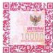
(Yanfa' Qurrota 'Ayun Sari)