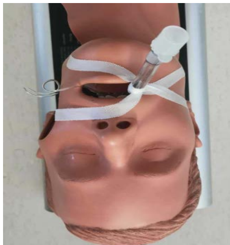
Gambar 2. 1 Teknik Lilitan/Silang

Keunggulan: Memberikan perlindungan lebih pada ETT agar tidak mudah bergeser (Li, et al. , 2021).