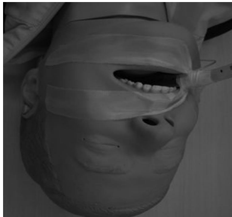
Gambar 2. 2 Teknik Layered Wrapping

Keunggulan: Memberikan kekuatan ekstra dan mengurangi risiko pergeseran. Cocok untuk penggunaan ventilasi jangka panjang (Shimizu, et al. , 2011).