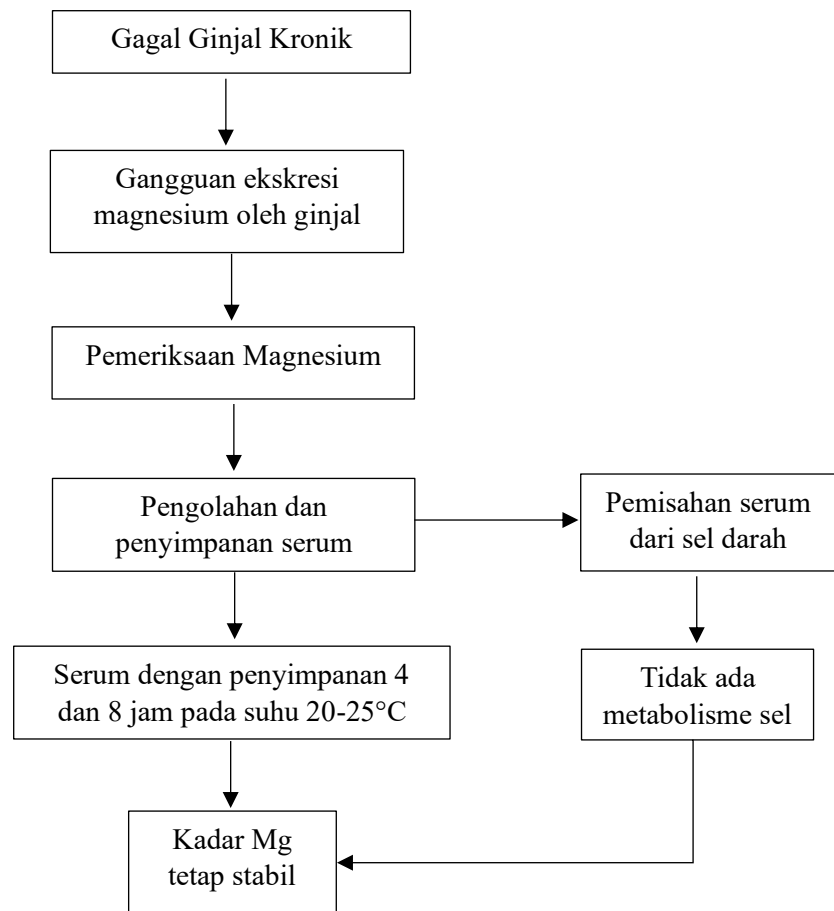
Gambar 2. Kerangka Teori