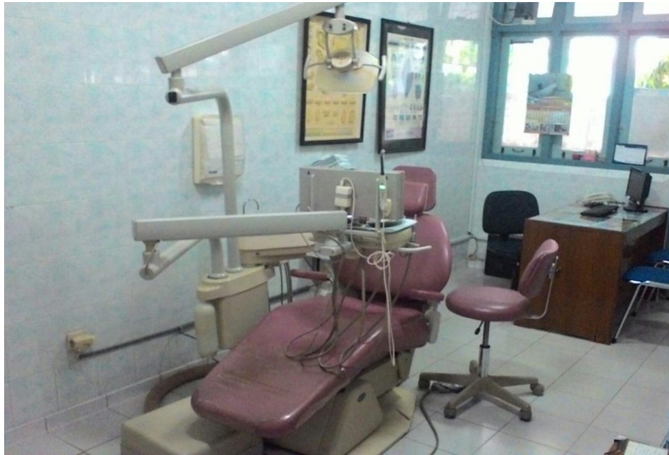
Gambar 3. Poliklinik Gigi RS. Panti Rini Kalasan