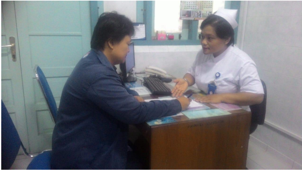
Gambar 4. Tahap memberikan PSP, informed consent , dan kuesioner pada responden