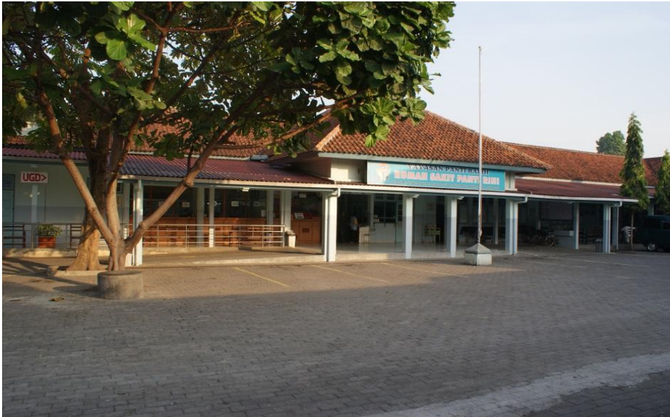
Gambar 2. Lokasi Penelitian