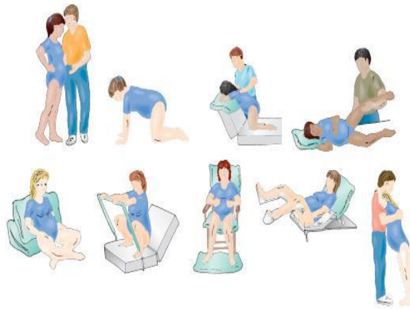
Figure 8-16 Positions for labor and pushing.