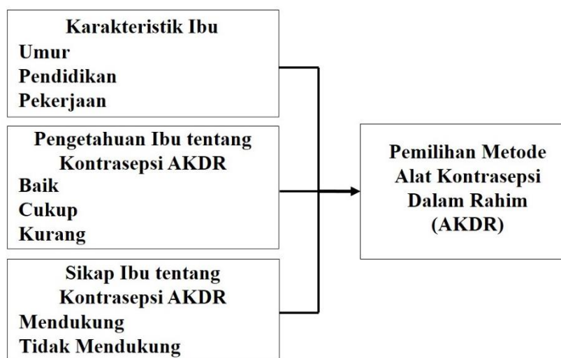
Gambar 2.2 Kerangka Konsep

Berdasarkan penjelasan dari fase-fase dalam kerangka teori, konsep teori L. Green dalam penelitian ini bisa digambarkan dalam kerangka konsep berikut.