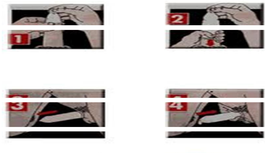
Gambar 1. Cara Pemakaian Kondom