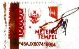
Suci Fitria Kurniawati