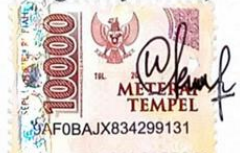
Wening Restu Nur Widiastuti