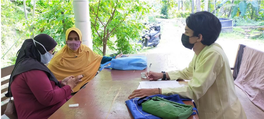
Gambar 7. Pengambilan data wawancara