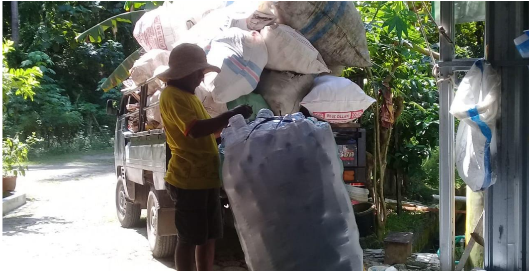
Gambar 5. Proses pengangkutan sampah