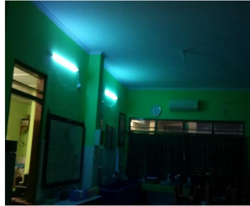
Penyinaran Lampu UV