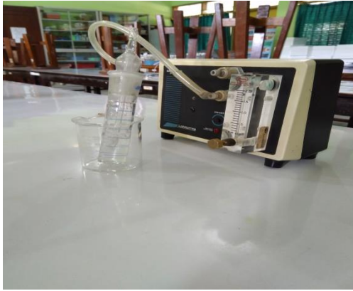
Midget impinger dan air sampling pump