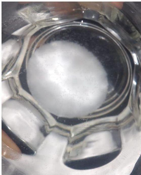
Endapan Putih Pada Dasar Gelas