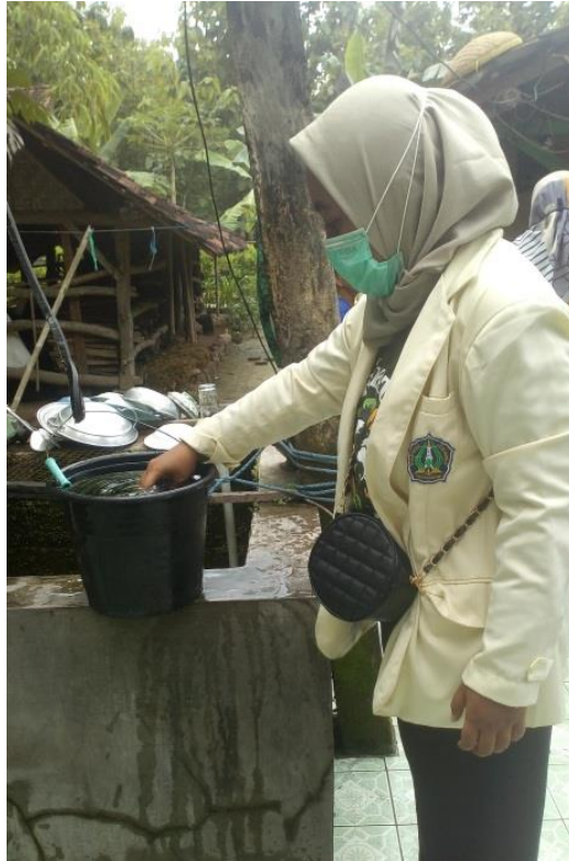
Pengambilan Sampel Air Sumur Gali