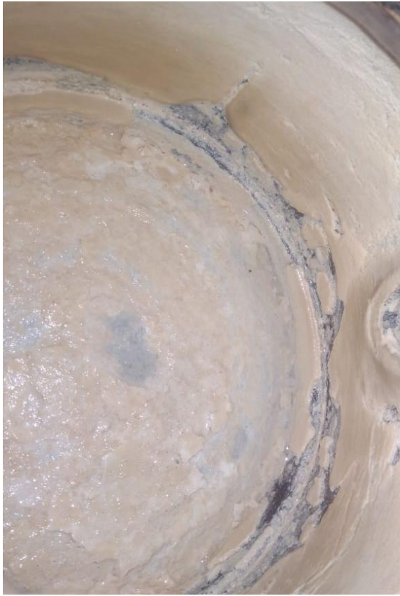
Kerak Pada Cerek