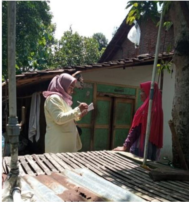
Pencatatan Hasil Wawancara Dengan Pemilik Sumur