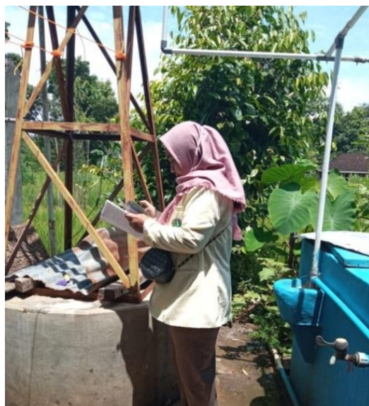
Penentuan Titik Koordinat Menggunakan GPS