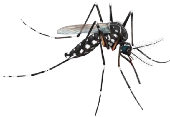
Gambar 5. Aedes sp dewasa

khas warna putih keperakan berbentuk lira (lengkung) pada kedua sisi skutum (punggung), sedangkan pada Aedes albopictus hanya membentuk sebuah garis lurus. Susunan vena sayap sempit dan hampir seluruhnya hitam, kecuali bagian pangkal sayap. Segmen abdomen berwarna hitam putih, membentuk pola tertentu, dan pada betina ujung abdomen membentuk titik meruncing (Service, 1997).