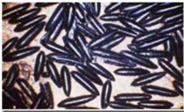
Gambar 2. Telur Aedes sp

Hasil penelitian Silva (2003), menunjukkan bahwa telur Aedes sp paling banyak diletakkan pada ketinggian 1,5 cm di atas permukaan air, dan semakin tinggi dari permukaan air atau semakin mendekati air jumlah telur semakin sedikit.