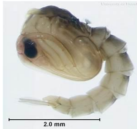
Gambar 4. Pupa Aedes sp (Sumber : Zettel, 2013)

Fase ini adalah periode waktu tidak makan dan sedikit gerak. Pupa biasanya mengapung pada permukaan air disudut atau tepi tempat perindukan (Silva, 2003).