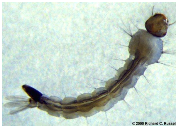
Gambar 3. Larva Aedes sp