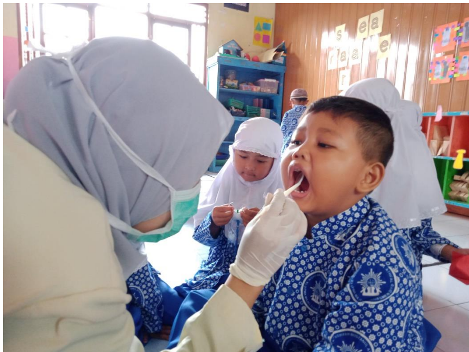
Gambar pemeriksaan karies gigi pada anak Taman Kanak-kanak ABA Sutopadan