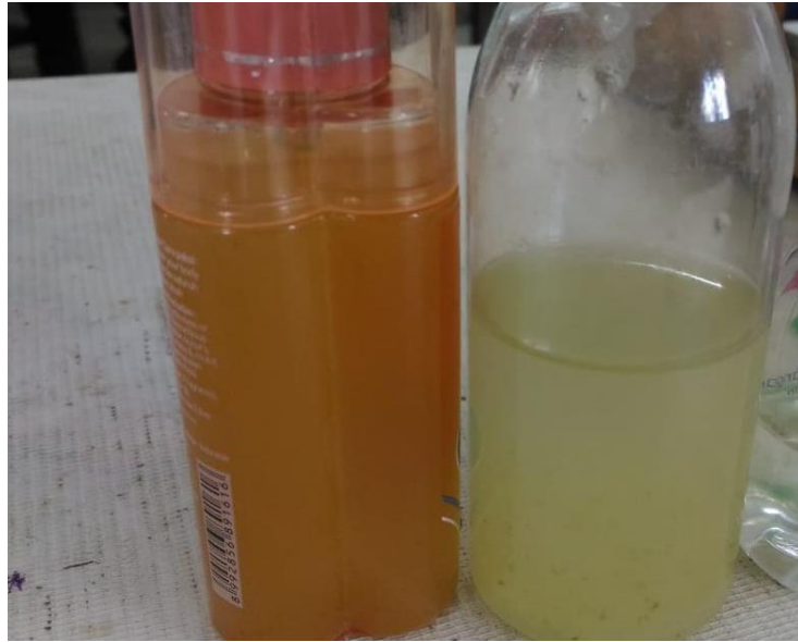
Gambar 3. Hand Sanitizer Campuran Pelepah Pisang dan Lidah Buaya