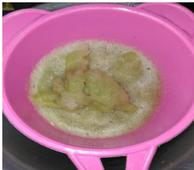
Gambar 2. Proses penyaringan sari pelepah pisang dan lidah buaya