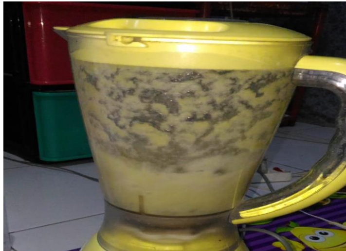
Gambar 1. Proses juicer pelepah pisang dan lidah buaya