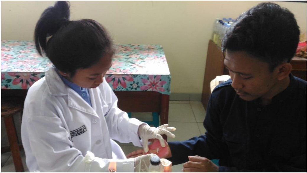
Gambar 5. Pengambilan Sampel Usap Tangan