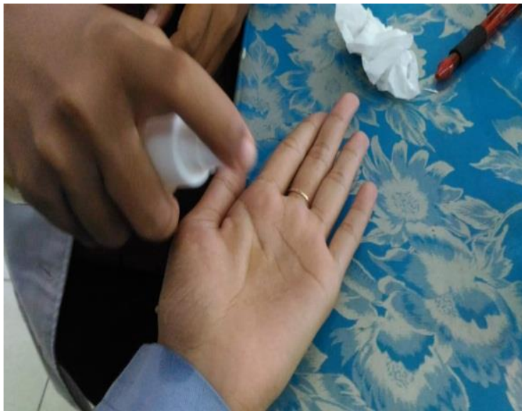
Gambar 4. Perlakuan dengan Hand Sanitizer