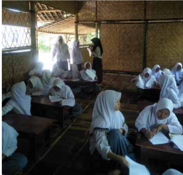
Foto 1. Peneliti melakukan pembagian kuesioner pengetahuan kepada santriwati di ruang kelas X pada tanggal 10 April 2019.