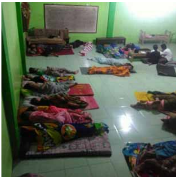
Foto 11. Gambar kondisi santri laki-laki pada saat tidur bersama-sama di aula asrama putra pada tanggal 5 Juli 2019.