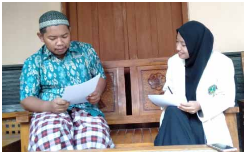
Foto 6. Peneliti sedang melakukan wawancara kepada responden santriwan di depan rumah pengurus Pondok Pesantren Ash-Sholihah pada tanggal 13 April 2019.