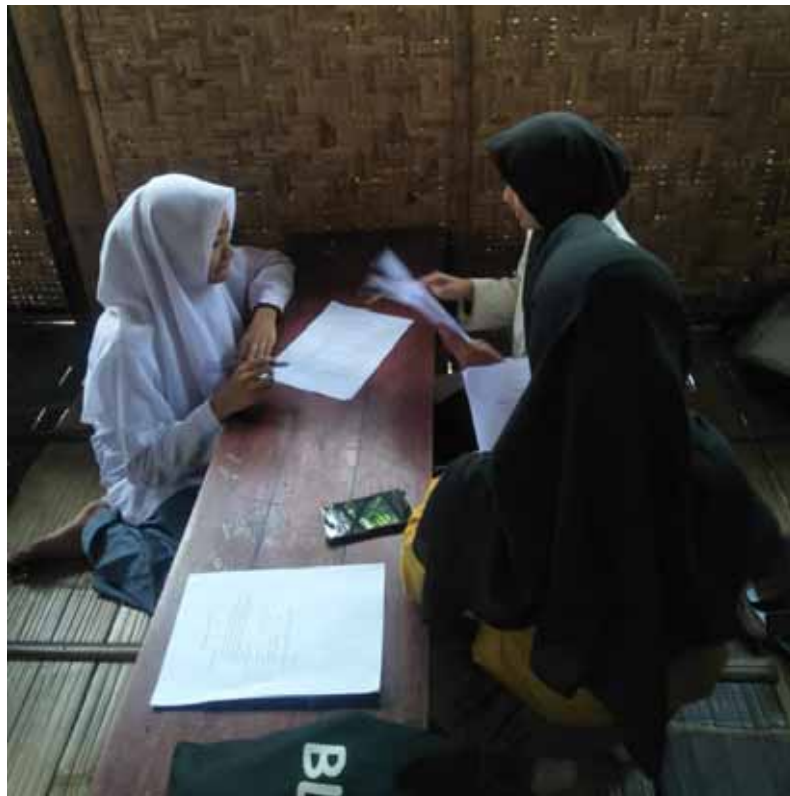
Foto 4. Peneliti sedang melakukan wawancara kepada responden di ruang kelas XI pada tanggal 11 April 2019.