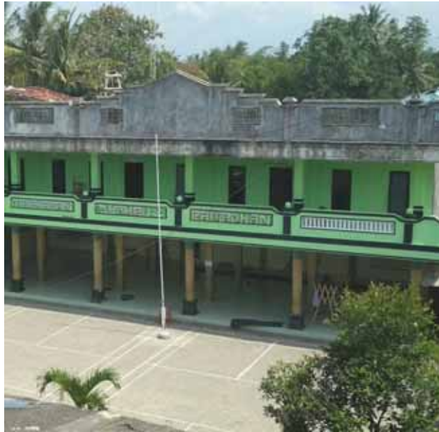
Foto 10. Lingkungan Madrasah Aliyah santri laki-laki Pondok Pesantren Ash-Sholihah.