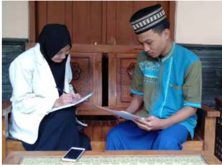
Foto 7. Peneliti sedang melakukan pengisian data responden di depan rumah pengurus Pondok Pesantren Ash-Sholihah pada tanggal 13 April 2019.