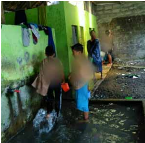
Foto 12. Kondisi kamar mandi dan bak clup kaki di asrama santri laki-laki pada tanggal 5 Juli 2019.