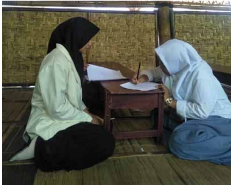
Foto 5. Santriwati sedang melakukan pengisian identitas responden di ruang kelas XI pada tanggal 11 April 2019.