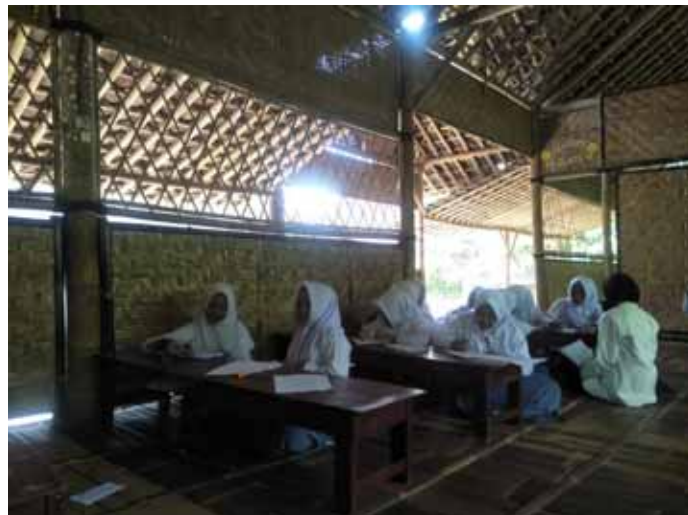
Foto 2. Santriwati sedang mengerjakan kuesioner pengetahuan di ruang kelas X pada tanggal 10 April 2019.