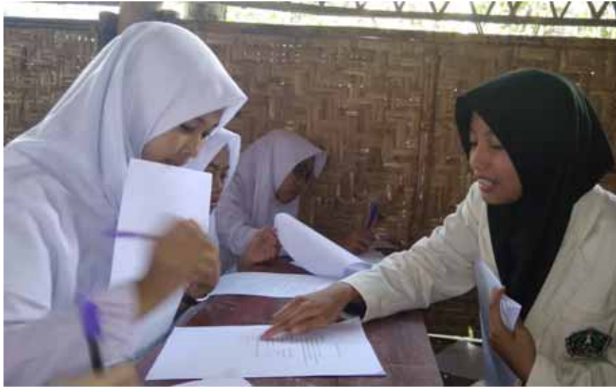
Foto 3. Peneliti sedang melakukan pengarahan pengisian identitas responden di ruang kelas XI pada tanggal 11 April 2019.