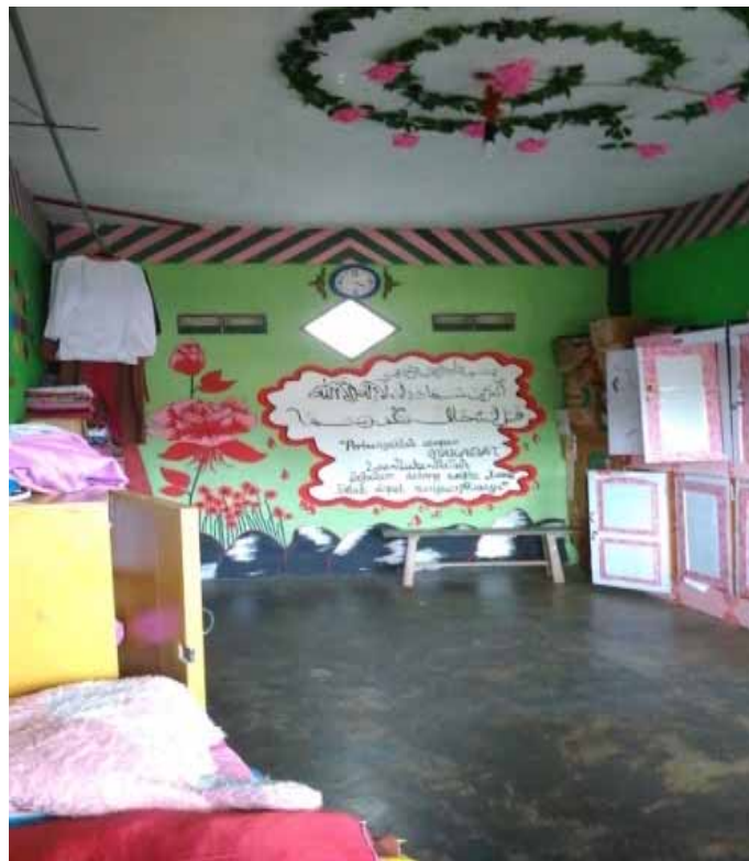
Foto 9. Kondisi Kamar santriwati Pondok Pesantren Ash-Sholihah Jonggrangan.