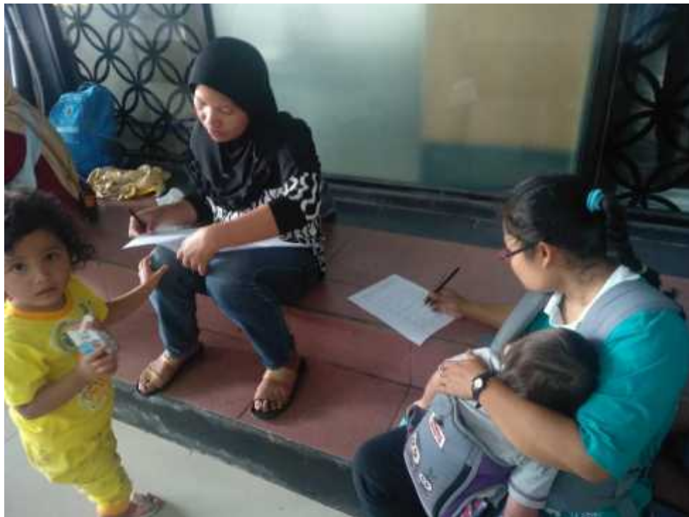
Pengisian Kuesioner sikap oleh ibu-ibu pengunjung Stasiun