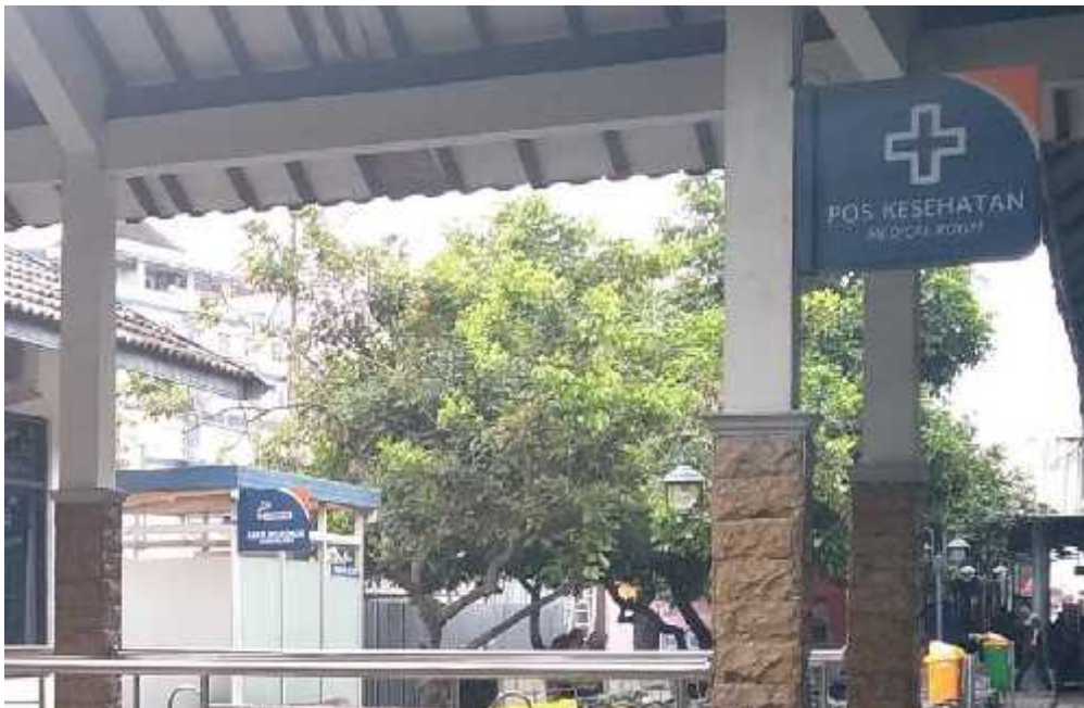
Smoking area berdekatan dengan bangunan Pos Kesehatan.