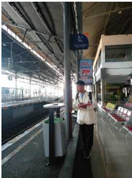
Check list pengawasan KTR pada ruang tunggu utara.