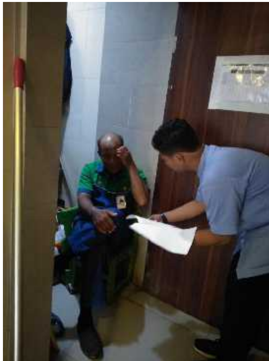
Permohonan izin menjadi responden kepada petugas kebersihan Stasiun