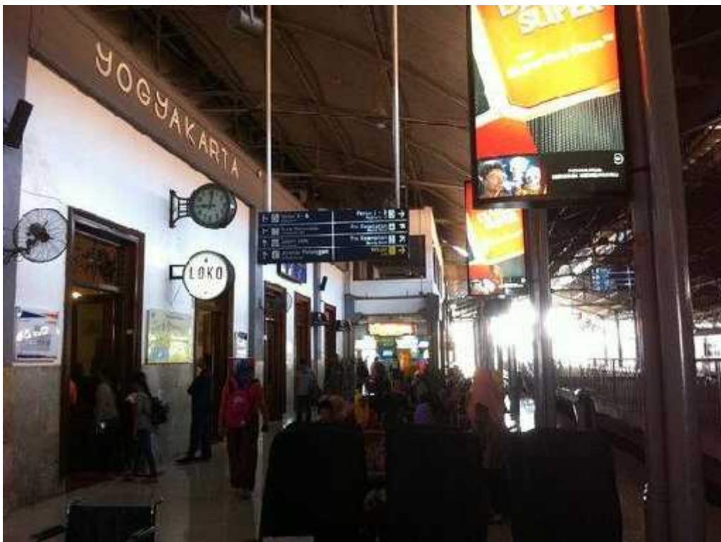
Ruang Tunggu Selatan yang masih terdapat banyak iklan produk Rokok.