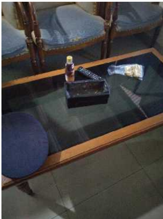
Temuan asbak rokok didalam ruang UPT SOT