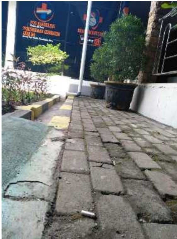
Temuan puntung rokok pada ruang tunggu terbuka yang berdekatan dengan pos kesehatan dan ruang laktasi