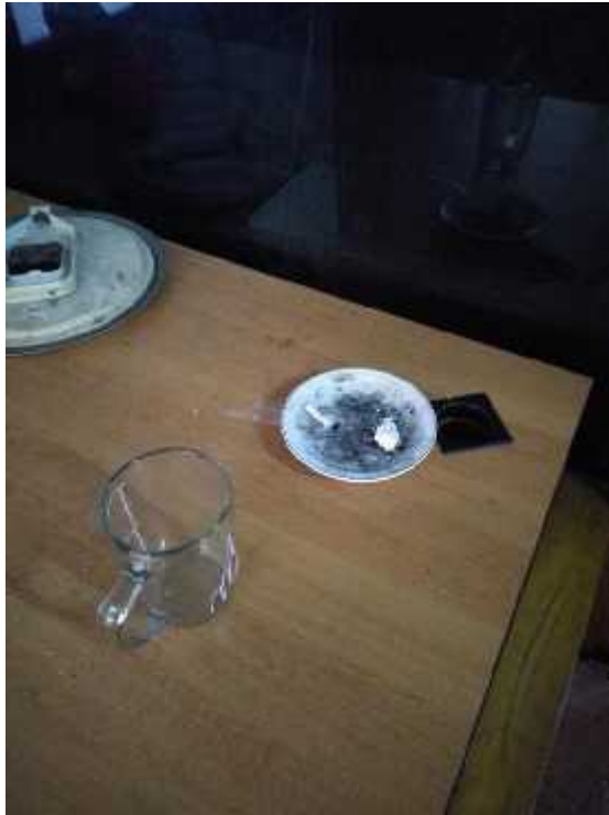
Temuan cawan yang dijadikan asbak rokok di depan ruang UPT SOT