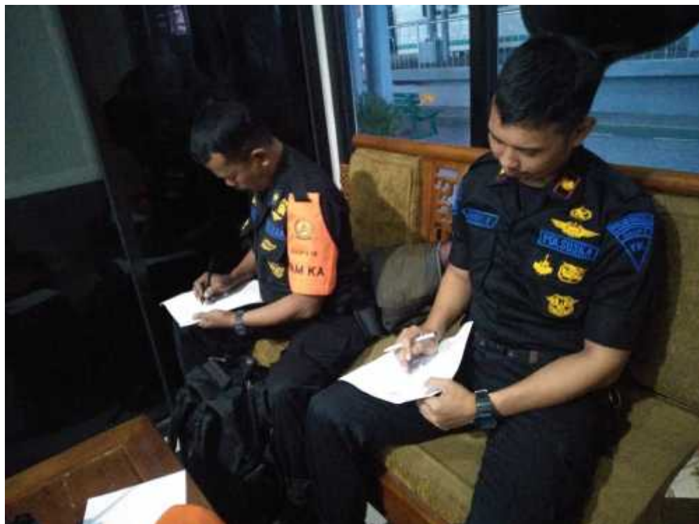
Check list pengawasan KTR pada ruang tunggu utara