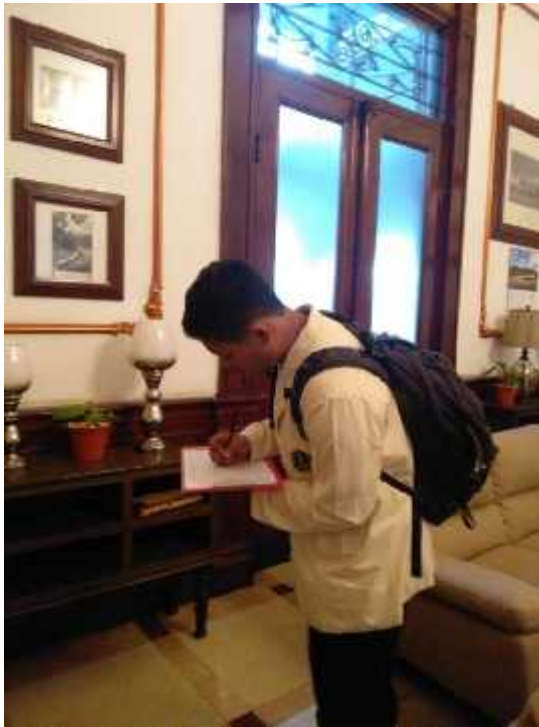
Check list pengawasan KTR pada ruang tunggu VIP