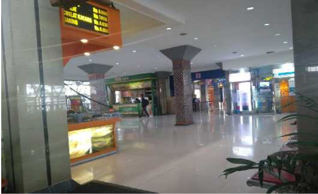
Boarding Pas Area belum terdapat tanda dilarang merokok.