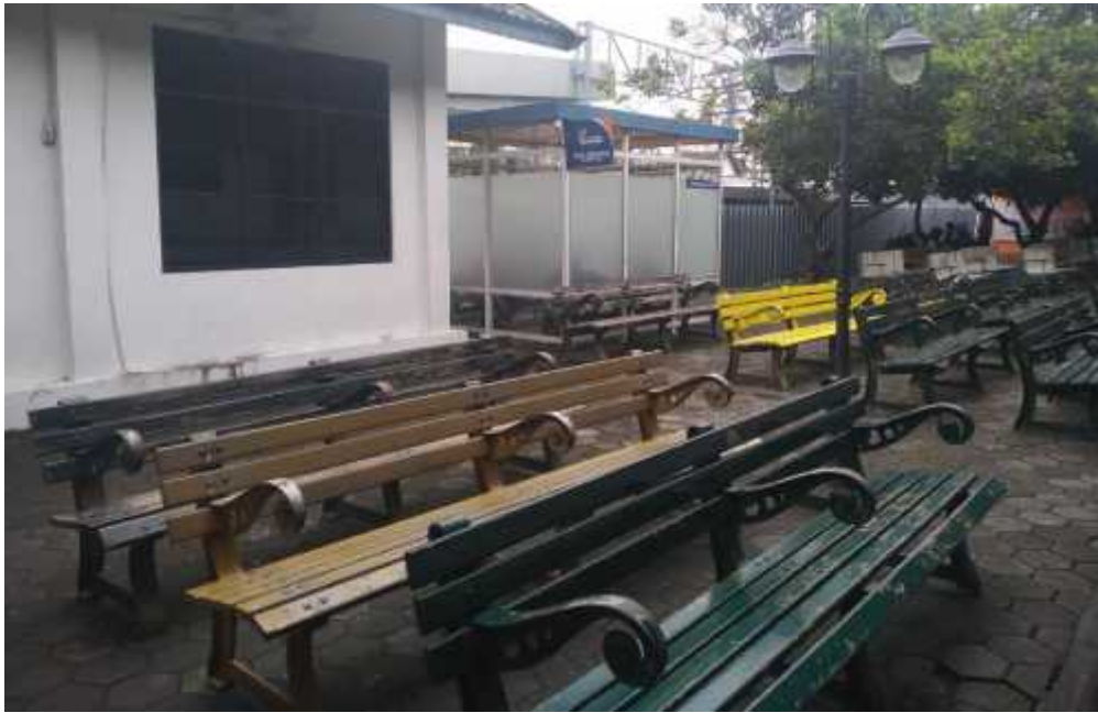
Smoking area dan ruang Ruang Tunggu menjadi satu.