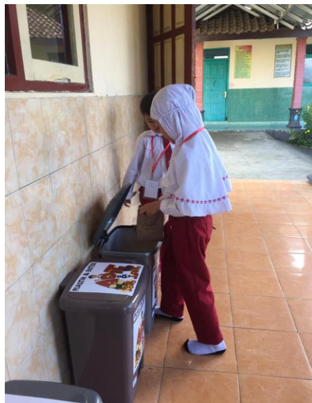
Siswa saat melakukan pemilahan sampah dengan baik yang peneliti amati