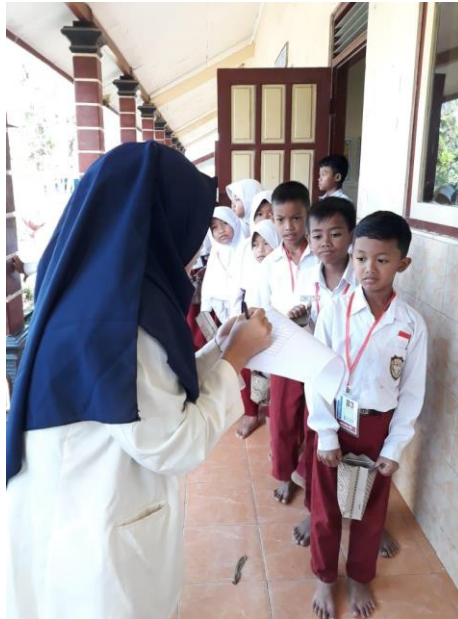
Peneliti mengabsensi siswa terlebih dahulu sebelum melakukan penelitian