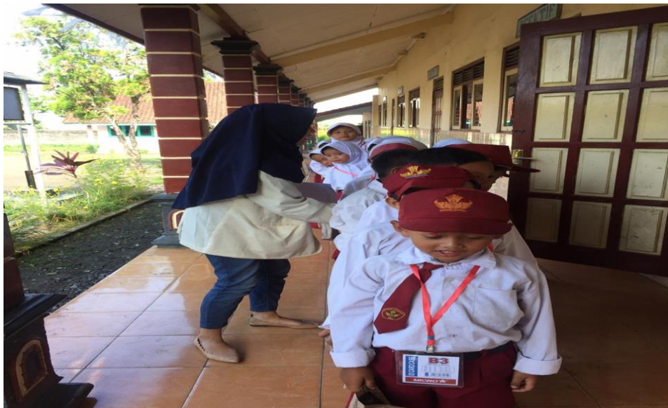
Siswa SDN Jamblangan berbaris terlebih dahulu sebelum melakukan penelitian untuk di absen