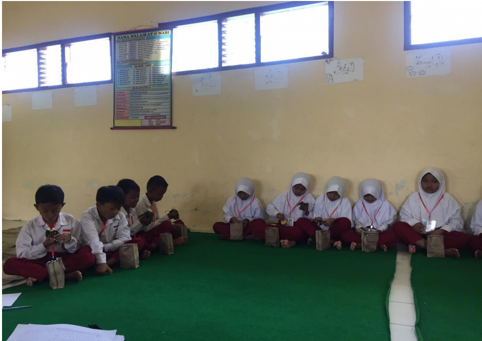
Siswa SDN Jamblangan (kelompok perlakuan) sedang memakan konsumsi dari peneliti sebagai bahan timbulan sampah untuk pengamatan