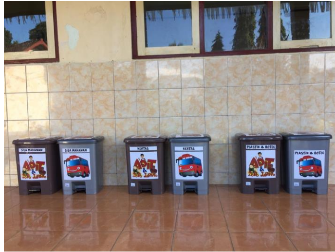
Tempat Sampah dengan gambar Nasional (Jarwo) dan Internasional ( Tayo )