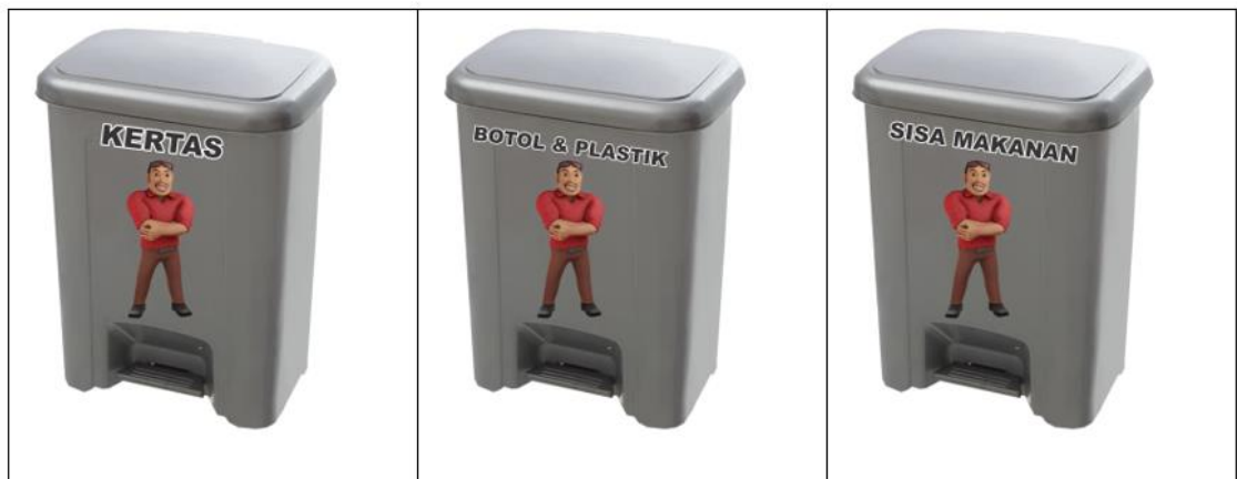
Lampiran 3. Tempat Sampah Bergambar Internasional (Tayo)