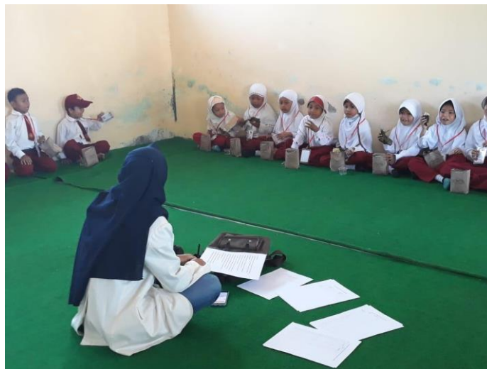
Penyuluhan tentang pengelolaan sampah di SDN Jamblangan Kecamatan Srumbung Kabupaten Magelang (kelompok perlakuan)