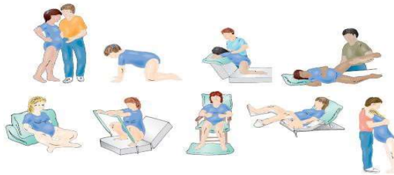
Figure 8-16 Positions for labor and pushing.

Posisi ibu melahirkan dapat membantu adaptasi secara anatomis dan fisiologis untuk bersalin. 26,30 Petugas kesehatan dapat memberikan dukungan pada ibu bersalin dengan cara memberi informasi mengenai posisi ibu bersalin.