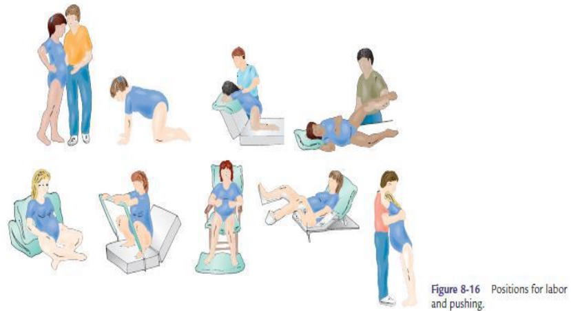
Gambar 1. Posisi Ibu Bersalin