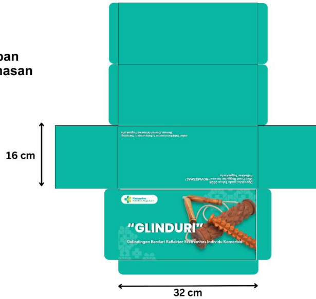
Tampak depan Design Kemasan Glinduri