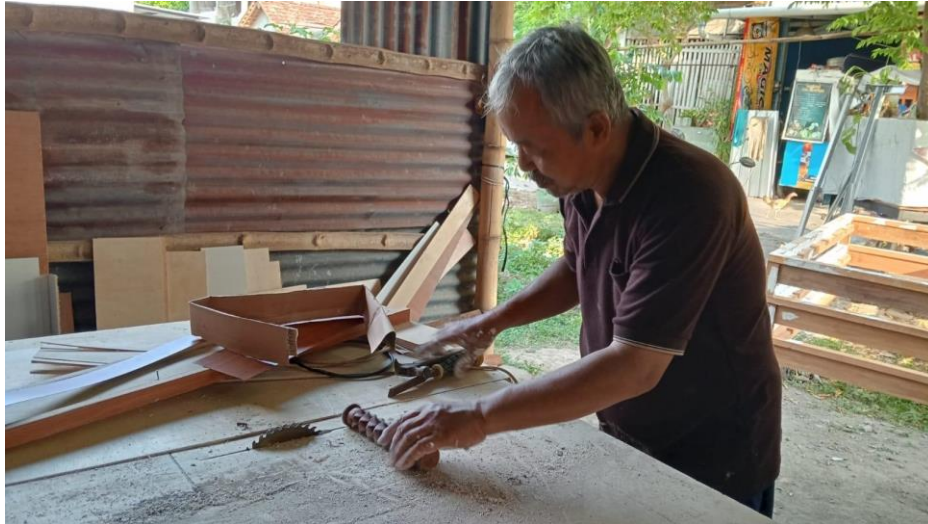
Lampiran 1 UMKM Marseno Kayu, Yogyakarta