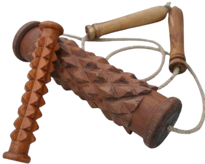
Gambar 1 Desain Gelindingan Berduri (GLINDURI) Reflektor Ekstremitas Individu Komorbid

Komponen fisik gelindingan berduri (GLINDURI) reflektor ekstremitas individu komorbid adalah sebagai berikut: