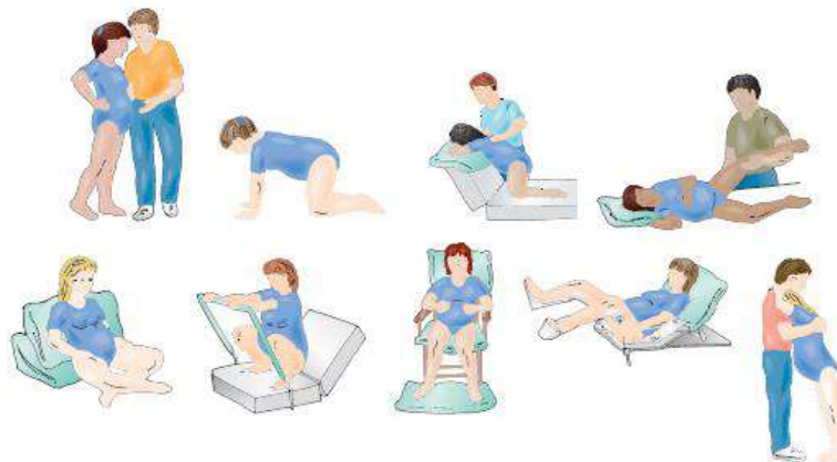
Figure 8-16 Positions for labor and pushing.

Posisi ibu melahirkan dapat membantu adaptasi secara anatomis dan fisiologis untuk bersalin. 26,30 Petugas kesehatan dapat memberikan dukungan pada ibu bersalin dengan cara memberi informasi mengenai posisi ibu bersalin.