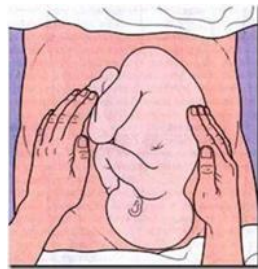
Gambar 3

Pemeriksaan Leopold II, untuk mengetahui letak janin memanjang atau melintang, dan bagian janin yang teraba disebelah kiri atau kanan.