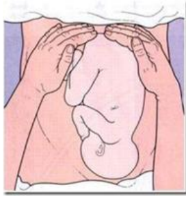
Gambar 2.