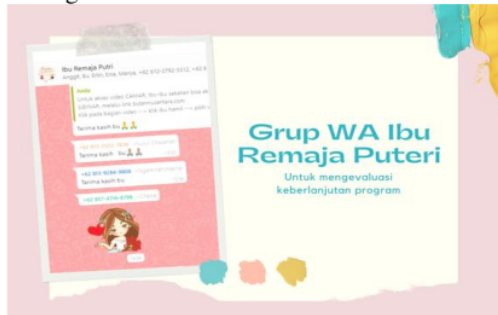
Gambar 4. Evaluasi melalui Grup Whatsapp

Pada akhir kegiatan FGD, dilakukan evaluasi terhadap pelatihan yang telah dilakukan yaitu melakukan pengulangan kembali materi secara singkat dan menyimpulkan materi yang telah didapatkan, dengan cara keluarga menyampaikan persepsi terhadap materi yang telah dipahami. Monitoring keluarga dilakukan sesuai dengan jadwal yang telah disepakati. Monitoring dilakukan oleh tim pengabdian masyarakat kepada keluarga melalui whatsapp grup . Hal ini dilakukan sebagai bentuk pendampingan oleh tim pengabdian kepada keluarga.