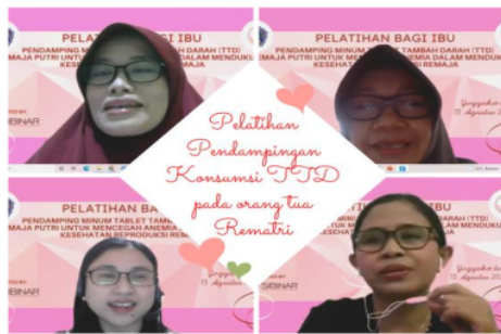
Gambar 1. Pembukaan Kegiatan FGD melalui zoom meeting

memperkenalkan diri untuk memulai hubungan baik selama kegiatan berlangsung.