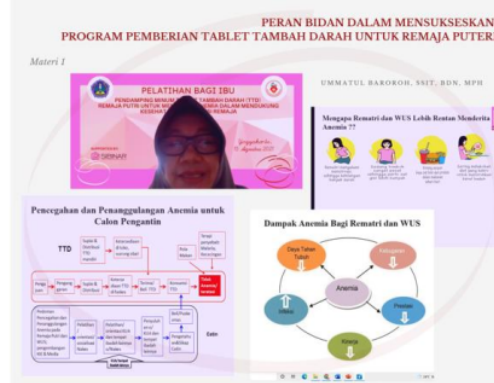
Gambar 3. Pemaparan Materi

terutama dalam penanganan remaja dan wanita usia subur (WUS). Berikutnya, materi kedua diberikan oleh narasumber yang ke 2, yaitu dosen Poltekkes Kemenkes Yogyakarta jurusan Kebidanan. Materi yang diberikan terkait dengan Peran Orangtua sebagai Pendamping Minum Tablet Tambah Darah. Pada materi ini disampaikan risiko yang terjadi jika remaja mengalami anemia, makanan yang mengandung zat besi, pengertian tablet tambah darah, cara minum obat tambah darah, dan manfaat pendampingan minum TTD. Tujuan pemberian materi ini adalah sebagai pengantar dan peningkatan sikap keluarga dalam pencegahan anemia. Dalam pemberian materi, peserta terlihat antusias dan aktif bertanya seputar dengan anemia dan cara pencegahan dini anemia pada remaja.