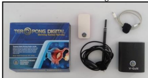
Gambar 2. Teropong Digital Skrining Kanker Serviks

Berdasarkan hasil wawancara pada ibu, ibu menyatakan jadi lebih memahami tentang kanker serviks, gambaran serviks dan skrining kanker serviks sehingga ibu merasa dapat lebih waspada terhadap dirinya sendiri. Ibu mengatakan bahwa ada rasa ingin untuk melakukan pemeriksaan IVA secara rutin dengan ikut serta mengamati gambaran serviks pada pemeriksaan. Visualiasi serviks yang terekam oleh teropong digital menjadi media untuk pemberian KIE. Berikut adalah dokumentasi kegiatan: