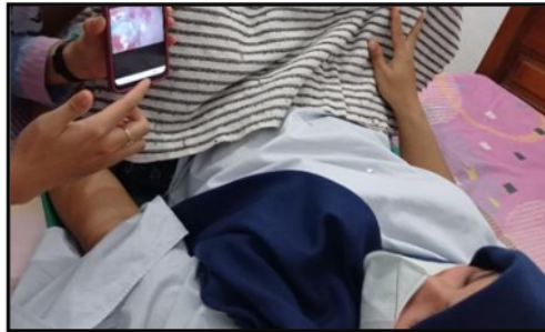
Gambar 4. Penggunaan teropong digital skrining kanker serviks oleh bidan dan pasien