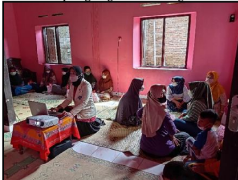
Gambar 3. Penyuluhan dan sosialisasi