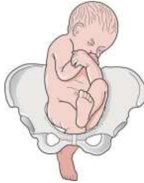
Gambar 2.3 Posisi janin Incomplete Breech