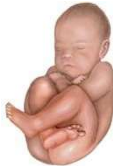
Gambar 2.2 Posisi janin Complete Breech