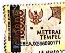
(Fadia Amely Ramadhesia)